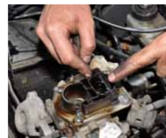
Wat een mooi stukje techniek eigenlijk, zo'n carburateur ...