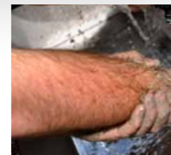
Vieze handen, dat hoort bij het nieuw verworven technische inzicht.