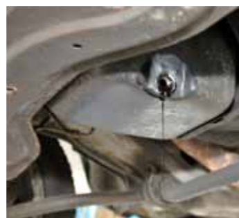
Olie verversen lijkt simpel, maar je moet wél weten wat je doet ...