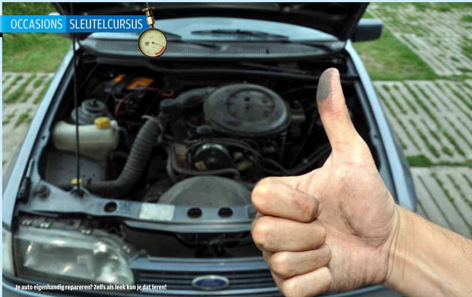
Je auto eigenhandig repareren? Zelfs als leek kun je dat leren!