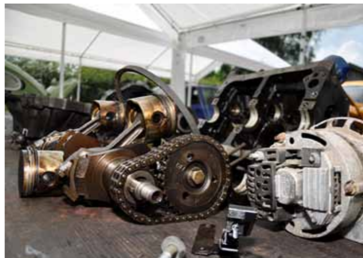
Het nut van auto's slopen? Alleen zo kun je het motorblok van binnen bekijken.