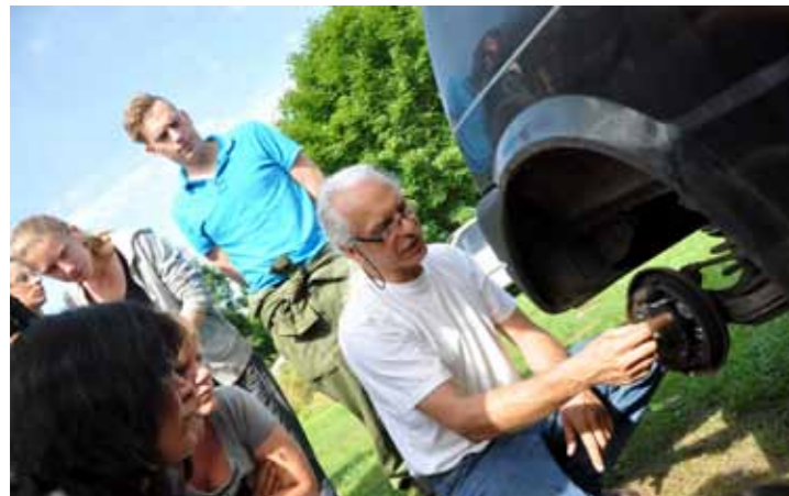
De trommelrem van een Cinquecento blijkt ook een leerzaam object.