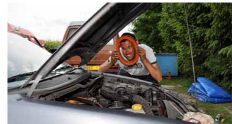
Aangenaam: het luchtfilter!