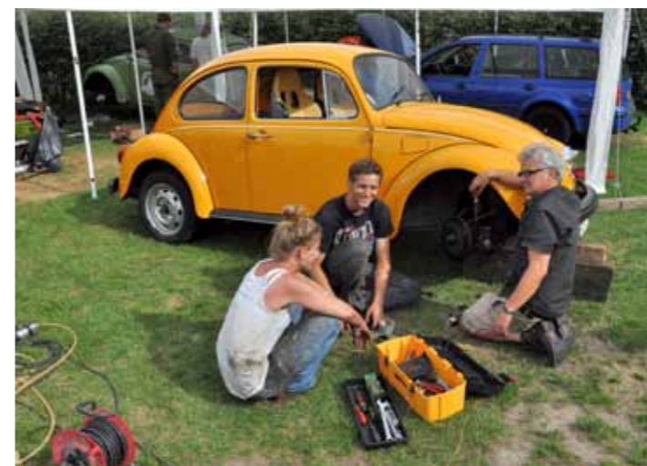
Lekker sleutelen in de wei: leerzaam en nog leuk ook!