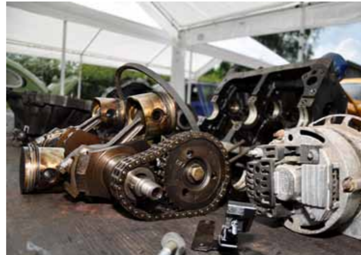
Het nut van auto's slopen? Alleen zo kun je het motorblok van binnen bekijken.