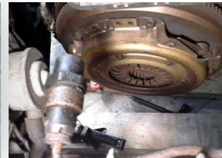
... of graaf je ineens zelfstandig de kapotte koppeling van een Ford Ka op.