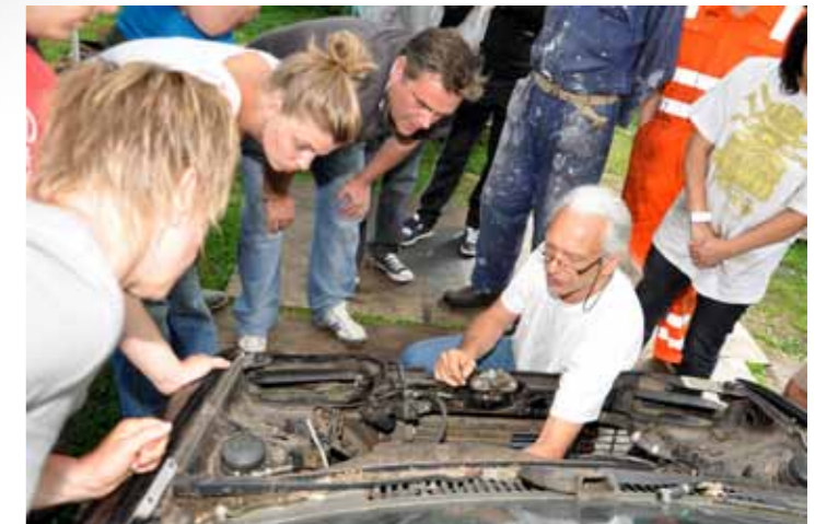
Inzichtelijk onderwijs in de praktijk

onderdelen en schroeven die nog altijd aan mijn voeten ligt, stellen ze me gerust: "Als je het uit elkaar kunt halen, kun je het ook weer in elkaar zetten. En als het niet lukt, helpen we je wel." Die hulp is niet nodig. Goed nadenken, goed kijken en, oké, één keer opnieuw beginnen en de boel zit in elkaar. De Sierra start en rijdt tot mijn grote verbazing zonder stotteren of bokken weg. Ik sta paf. De rit naar huis verloopt soepeler dan ooit; zo lekker heeft mijn Ford nog nooit gereden.