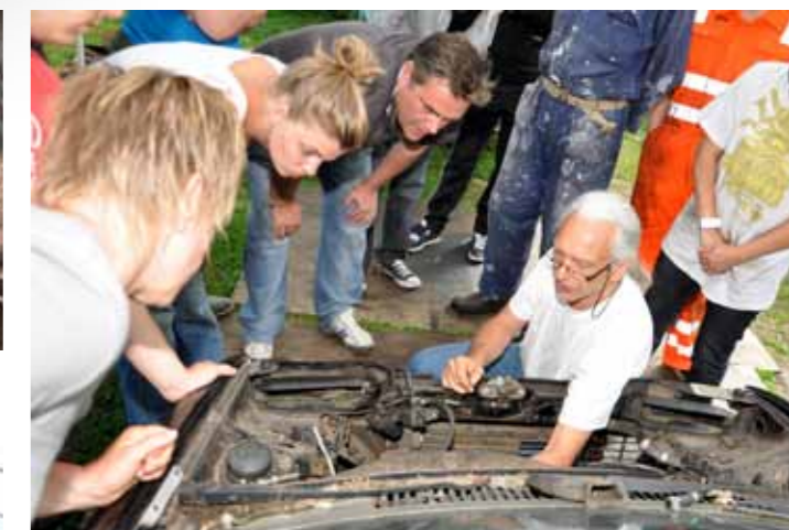
Inzichtelijk onderwijs in de praktijk

onderdelen en schroeven die nog altijd aan mijn voeten ligt, stellen ze me gerust: "Als je het uit elkaar kunt halen, kun je het ook weer in elkaar zetten. En als het niet lukt, helpen we je wel." Die hulp is niet nodig. Goed nadenken, goed kijken en, oké, één keer opnieuw beginnen en de boel zit in elkaar. De Sierra start en rijdt tot mijn grote verbazing zonder stotteren of bokken weg. Ik sta paf. De rit naar huis verloopt soepeler dan ooit; zo lekker heeft mijn Ford nog nooit gereden.