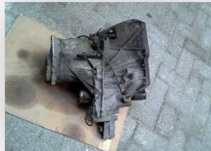
Even aan een paar schroeven draaien en er ligt een versnellingsbak aan je voeten ...