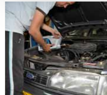
Met een paar liter verse olie kan je auto er weer tegen!