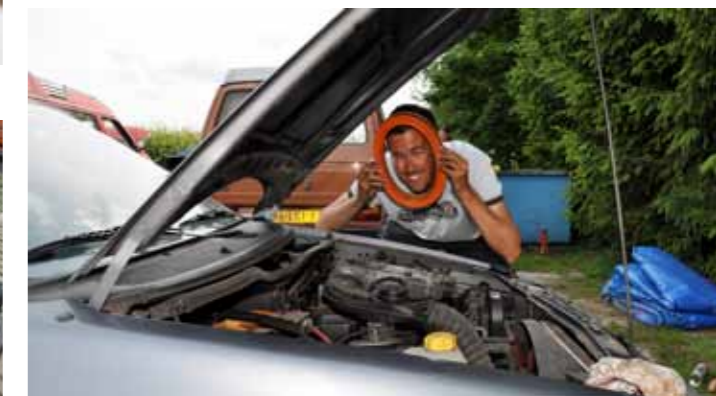
Aangenaam: het luchtfilter!