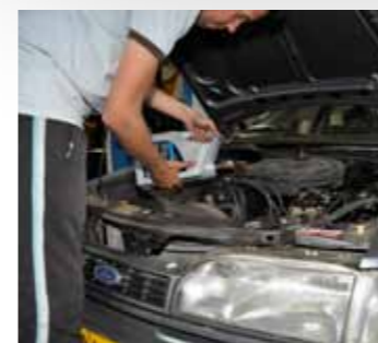
Met een paar liter verse olie kan je auto er weer tegen!