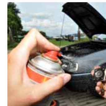
Even reinigen en de acceleratiepomp kan teruggezet worden: probleem opgelost.