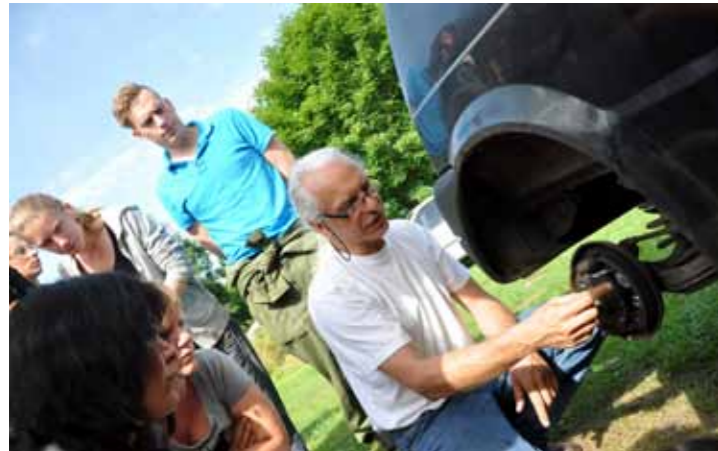
De trommelrem van een Cinquecento blijkt ook een leerzaam object.