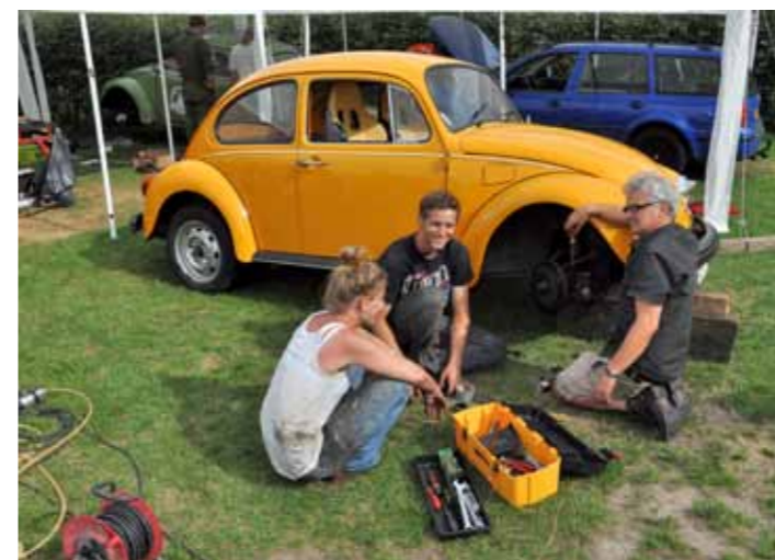
Lekker sleutelen in de wei: leerzaam en nog leuk ook!