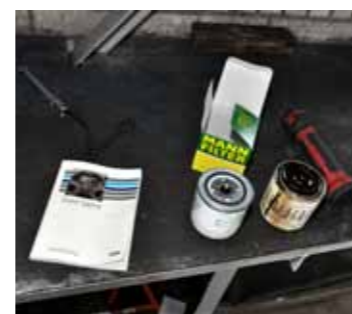
Het oude naast het nieuwe filter. Zoek de tien verschillen ...