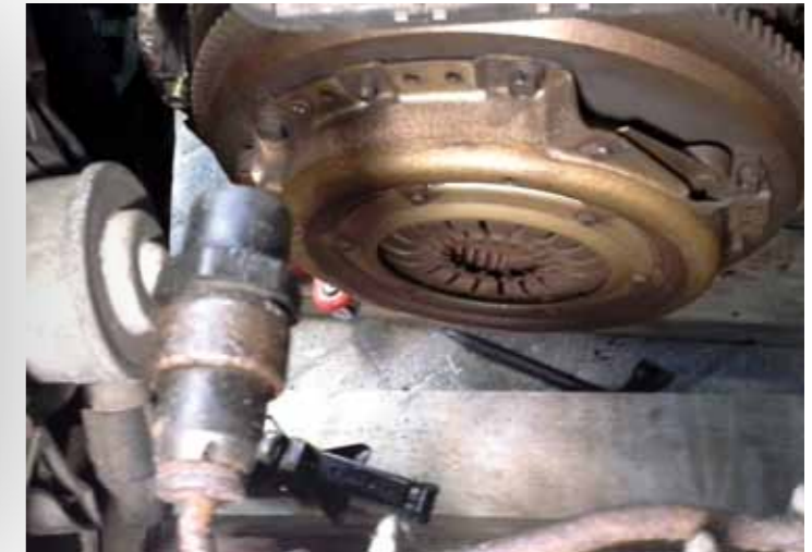
... of graaf je ineens zelfstandig de kapotte koppeling van een Ford Ka op.